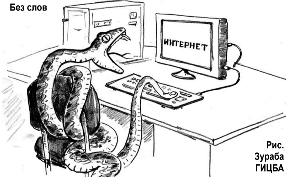
Рис. Зураба ГИЦБА

на это свою единственную жизнь?». Под «этим» она подразумевает, в частности, и многие тексты в Фейсбуке, напоминающие ей помойку. А сколько в соцсетях и на некоторых сайтах действительно можно встретить «бесмысленных и беспощадных» безумно длинных полемических диалогов, анонимные и неанонимные авторы которых демонстрируют и невежество свое, и хамство, и просто тупость! Так вот, от друзей узнал, что в последнее время некоторые анонимы в своих группах в Фейсбуке начали доставать политических «неприятелей». Размещая, например, фото с намеком на то, что те, мужчина и женщина, совместно посещали сауну. (Кто-то потом «вычислил», что снимок, где фигурировали другие люди, был вроде бы взят из московской «Экспресс-газеты»). Когда комментаторы на форуме «Абхаз-авто» узнали, как и я, о чем шла речь в обращении в Генпрокуратуру, содержание их комментов существенно изменилось.