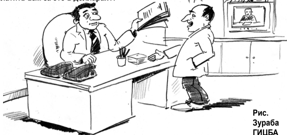
Рис. Зураба ГИЦБА

Не проще и честнее ли сказать, что выполнение закона в полном объеме оказалось пока для нашего государства — Значит, Дикран Мамедович, вы предлагаете давать вам переводить всю документацию нашего ведомства на абхазский язык и платить вам за это в долларах?!