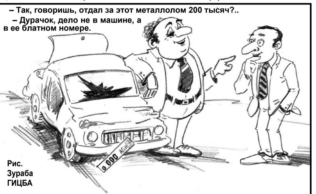
Рис. Зураба ГИЦБА

Во многом благодаря финансовому кризису и обесцениванию рубля спрос на отдых в Абхазии начал набирать обороты. В свою очередь, это будет способствовать стабилизации социально-экономических настроений в абхазском обществе. Соответственно, отдых в Абхазии для россиян станет еще более комфортным.