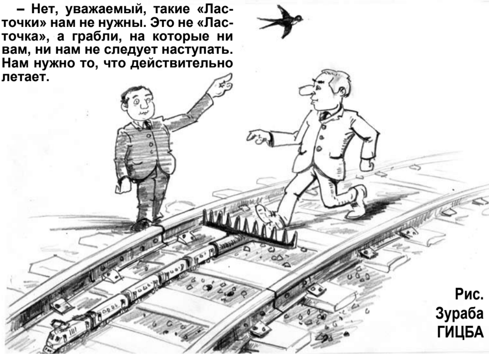
Рис. Зураба ГИЦБА

- Нет, уважаемый, такие «Ласточки» нам не нужны. Это не «Ласточка», а грабли, на которые ни вам, ни нам не следует наступать. Нам нужно то, что действительно летает.